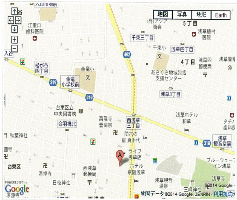
大きな地図で見る